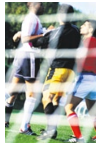
Le climat est parfois tendu dans les ligues inférieures.

Pour dénoncer les cas: 079 951 25 10 ou contact@farenet.ch