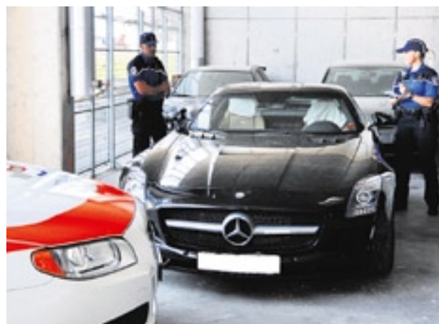
Cette Mercedes-Benz a été flashée à 290km/h, début août.